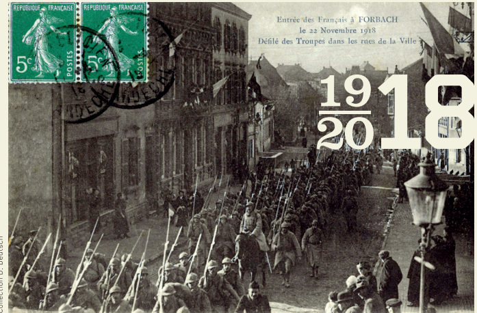
Entrée des Français à Forbach le 22 novembre 1918. Défilé des troupes dans les rues de la ville. Einzug der Franzosen in Forbach am 22. November 1918. Marsch durch die Straßen der Stadt.